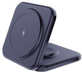
マグセーフ 折りたたみ式充電ステーション